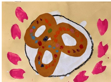
3歳児 おひさま組 「ドーナツやさんのおてつだい」