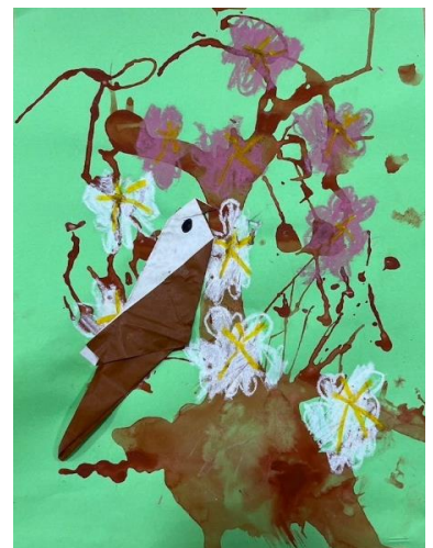
4歳児 そら組 「さくらがさくと」