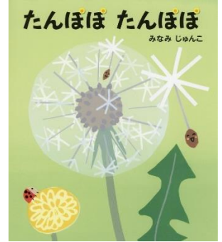
0、1歳児 はな組 「たんぽぽたんぽぽ」