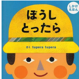
2歳児 ほし組 「ぼうしとったら」