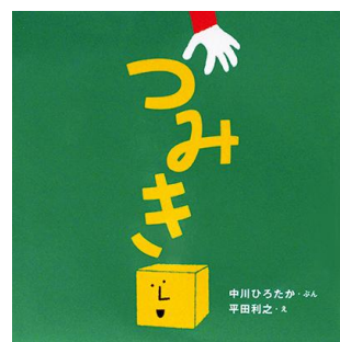
2歳児 ほし組 「つみき」