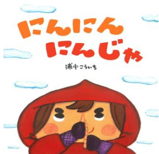
5歳児 にじ組 「にんにんにんじゃ」