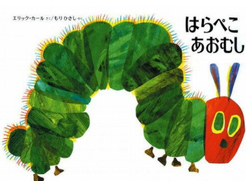
3歳児 おひさま組 「はらぺこあおむし」