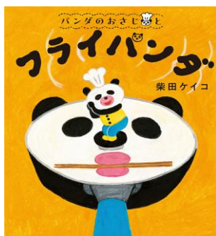
4歳児 そら組 「フライパンダ」